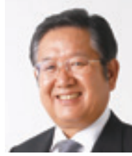
顧問・衆議院議員 左藤 章