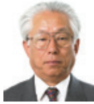
大阪府中小企業団体中央会 会長