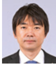
大阪市長 橋 下 徹