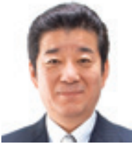
大阪府知事 松 井 一 郎